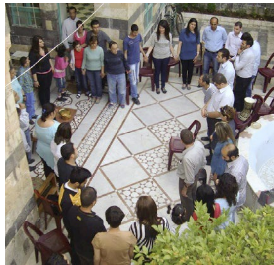
De Ark Al-Safina Dag gebed en vasten voor vrede in Syrië

G od is dorstig naar eenheid. Hij verlangt om alle uiteengejaagde kinderen van God te verenigen, om de muren neer te halen die mensen verdelen, om het leven terug te laten herboren worden. God weent om de verdeeldheid. God wil dat we de eenheid vieren en dat we ons nederig en arm inzetten voor die eenheid. Deze God is zo verborgen achter al het lawaai en de stress van onze samenlevingen. Hij is daar, Hij wacht, Hij wacht op een ontmoeting, Hij wacht op mij, op ieder van ons. Bidden we samen voor onze wereld die haar pijn uitschreeuwt.